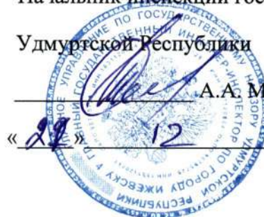
График проведения технического осмотра самоходных и иных машин и прицепов к ним в АПК и сельских поселениях Можгинского района в 2022 году